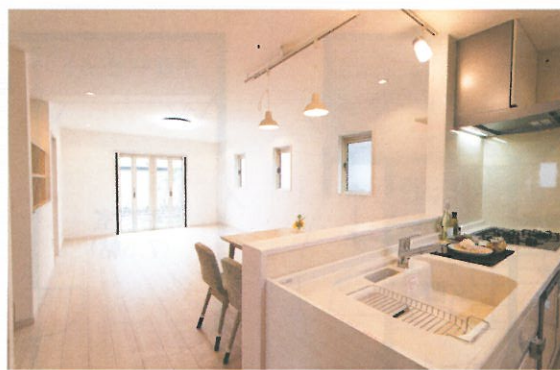
家族のコミュニケーションと 笑顔が弾むキッチン